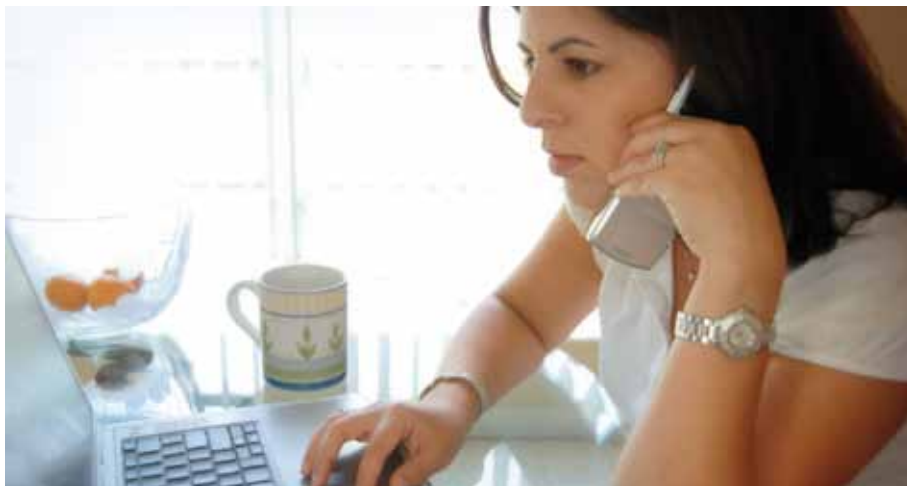
Freier Dienstnehmer: Dem echten Dienstnehmer fast gleichgestellt