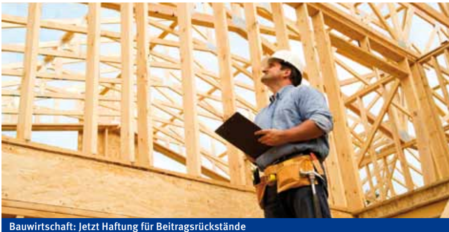
Bauwirtschaft: Jetzt Haftung für Beitragsrückstände

nachzuweisen. Jeder Krankenversicherungsträger führt HFU-Listen, die vom Dienstleistungszentrum tagesaktuell zu einer HFU-Gesamtliste zusammengeführt werden. Der Auftraggeber kann über WEBEKU (Online-Dienst der Sozialversicherung) Einsicht in die HFU-Gesamtliste nehmen.